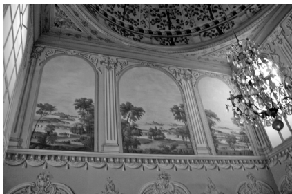
Image 9 - Coupole