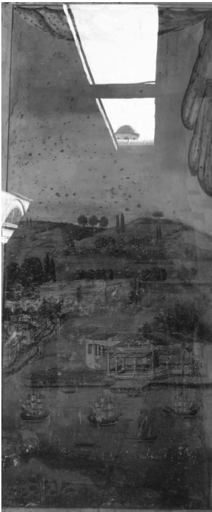
Image 5 - Yali

Le dessin qui se trouve à droite de la porte (P2) met en scène un paysage avec un kiosque au bord de la mer. Le panneau (187 cm x 87 cm) comporte deux parties, la première illustre la mer et la nature verdoyante, et la partie supérieure, le kiosque blanc aux volets ouverts avec une avancée vers la mer. Ce bâtiment est peint en blanc et a des tuiles rouges. A gauche du kiosque coule une rivière. Aux alentours, on perçoit d'autres bâtiments, ainsi que des bateaux à voiles et des caïques. Sur le bord supérieur du panneau, on observe un rideau tiré par des rubans (images 6-7).