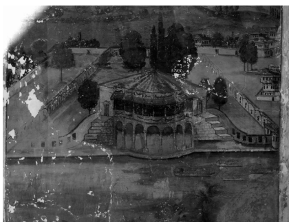
Image 4 - Hôtel particulier