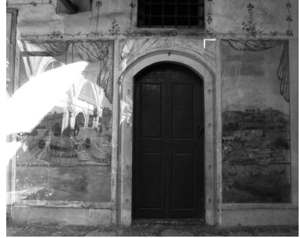
Image 2 - Foyer

Les deux panneaux qui font l'objet de cette étude se trouvent sur les deux côtés de la porte en bois qui s'ouvre sur le foyer où l'on préparait le café (image 2). De part et d'autre de cette porte se situent donc deux panneaux qui illustrent un paysage de la Corne d'or. Il faut ajouter qu'il existe, à gauche de la porte, un troisième panneau représentant un jardin avec deux fontaines à jets d'eau (image 3), il s'agit d'une disposition fantastique concernant ce paysage de jardin (A). Soulignons que, dans cette étude, nous ne prenons pas en considération ce panneau qui ne fait pas partie intégrante avec les deux panneaux qui constituent notre corpus. Elle paraît remplir une fonction purement ornementale par rapport à la disposition de ce mur et comporte, du point de vue stylistique et thématique, des divergences par rapport aux deux autres; alors que les deux autres sont dans une relation de complémentarité.