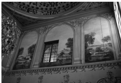
Image 8 - Coupole

A titre d'exemple, nous pouvons citer la Chambre de la Sultane Mère sous la coupole, qui représente la même logique constructive. Sous la coupole, dans les directions du sud et du nord, se trouvent des fenêtres rectangulaires, en demi-cercle. Sur les deux autres murs, il se trouve des fenêtres peintes, de la même taille que les fenêtres réelles et qui prolongent les décorations ornementales de celles-ci. Chacunes de ces fenêtres illusoire représentent un paysage, et elles sont observables par une fenêtre qui donne sur le sofa de la Chambre de la Sultane Mère. Autrement dit, quand les dames ouvraient leur fenêtre, elles apercevaient, à l'étage supérieur, les paysages créés sur le mur d'en face (image 8).