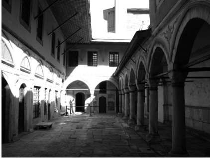
Image 1 - Cour des concubines