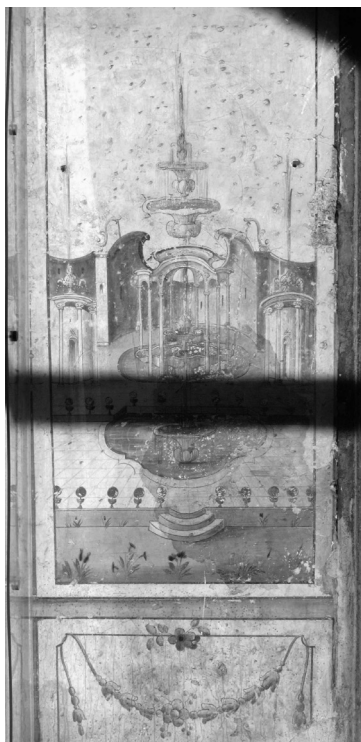
Image 3 - Jardin avec fontaines