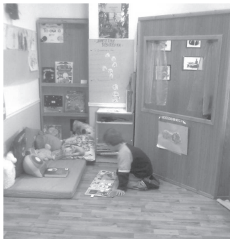
Figure 5 L'enfant forme un lieu personnel dans l'espace de la classe (Projet de réaménagement pédagogique de l'École maternelle de l'Université Aristote de Thessaloniki, Salle 1. Étude et réalisation, D. Germanos, 2007.)