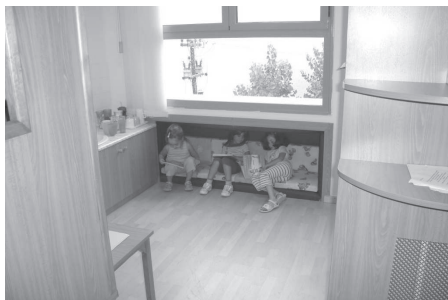
Figure 4 Des lieux éducatifs : petit recoin sous la fenêtre (Projet de réaménagement pédagogique de l'École maternelle de l'Université Aristote de Thessaloniki, Salle 1. Étude et réalisation, D. Germanos, 2007.)