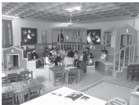
Figure 3 Vue de la salle de classe de la figure 2

Du côté de l'organisation de l'espace, l'environnement éducatif doit être joli, adapté à l'enfant et agréable à vivre. Il faut, d'abord, étudier les stimuli et les couleurs de l'espace afin de créer une ambiance associée à l'image de la maison. Au niveau du design, la référence à la maison s'appuie sur le choix des matériaux, des formes, des dimensions et des couleurs concernant les meubles, les équipements et les revêtements. Il en est de même avec la gestion de la lumière, naturelle et artificielle, tant pour établir des conditions convenables d'éclairage, que pour créer une ambiance conviviale dans l'environnement éducatif (Weinstein, David, 1987). De cette manière, l'organisation de l'espace peut contribuer a) au développement de la sensibilité, ainsi qu'à la maturation esthétique et culturelle de l'enfant et de l'enseignant et, b) à la création d'un climat psychologique positif en classe (figure 3).