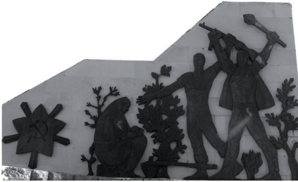
La Nation victorieuse - 1941-1945. Croatie 1991

Que peut-on attendre de l'Europe ? les évènements sanglants de Bosnie ont laissé place à l'amertume et à la déception. Les prochains élargissements de l'Union ne sont que des épiphénomènes qui confortent l'indécision et l'absence de Grande Politique. Dans son ouvrage, Après la crise - 2010 , Alain Touraine 2 s'interroge sur le sens de cette crise et surtout comment nous en sortir dans un monde de plus en plus interdépendant.