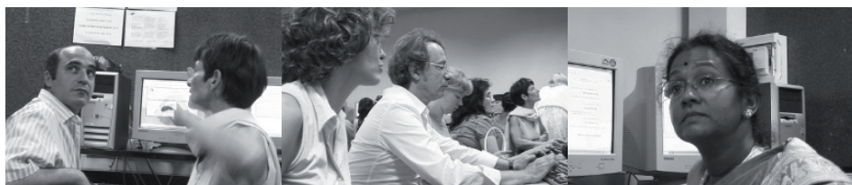
Salle informatique LP - CLA 2007

En ce qui concerne ce que Gosia appelle « le forum du site gerflint.eu » il serait bon qu'il s'adresse uniquement aux contacts venant de l'extérieur afin que gerflintforumpro serve au travail interne sinon on risque de tout mélanger alors même que la majorité des mels se font comme maintenant sur des courriels privés, ce qui fragmente l'information. Il faut éviter le risque de confusion.